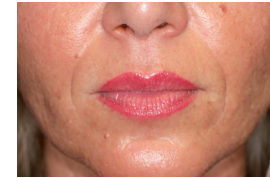
Nasolabiala - före