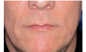
Labial vinkel - efter 14 dagar