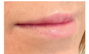
Läpp volym - efter 14 dagar