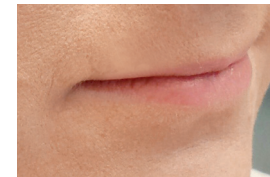
Läpp volym - före