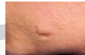
Årr behandling - före