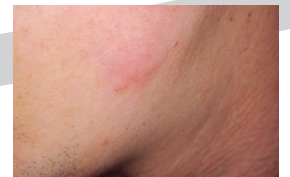
Årr behandling - efter 14 dagar