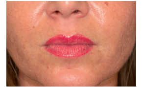
Nasolabiala - efter 14 dagar